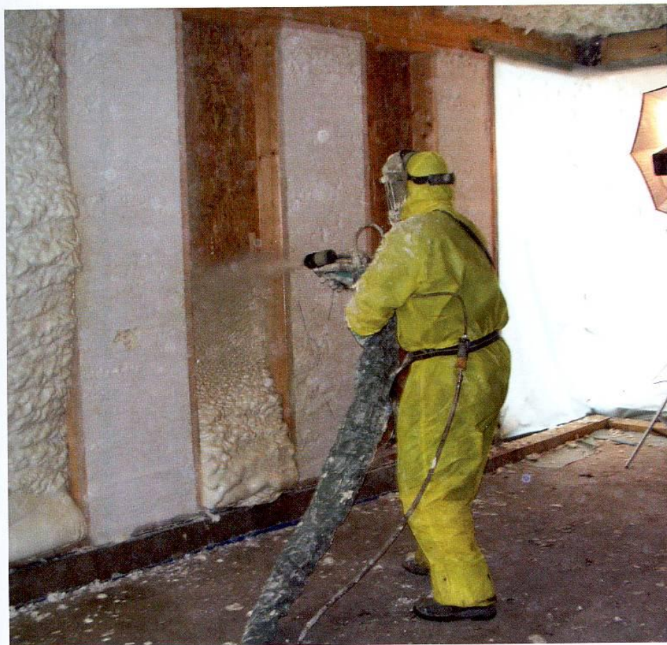
Une fois expansée, la mousse devient monolithique, ce qui supprime les ponts thermiques. (doc SMP)

Un bâtiment municipal en bois et à énergie positive en pleine campagne troyenne ! Le village de Payns s'est même offert le luxe d'isoler sa nouvelle salle polyvalente avec une mousse écologique qui a fait ses preuves en Amérique du Nord.