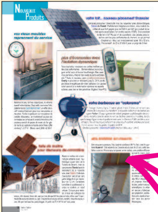
Voir Faire Faire p.12